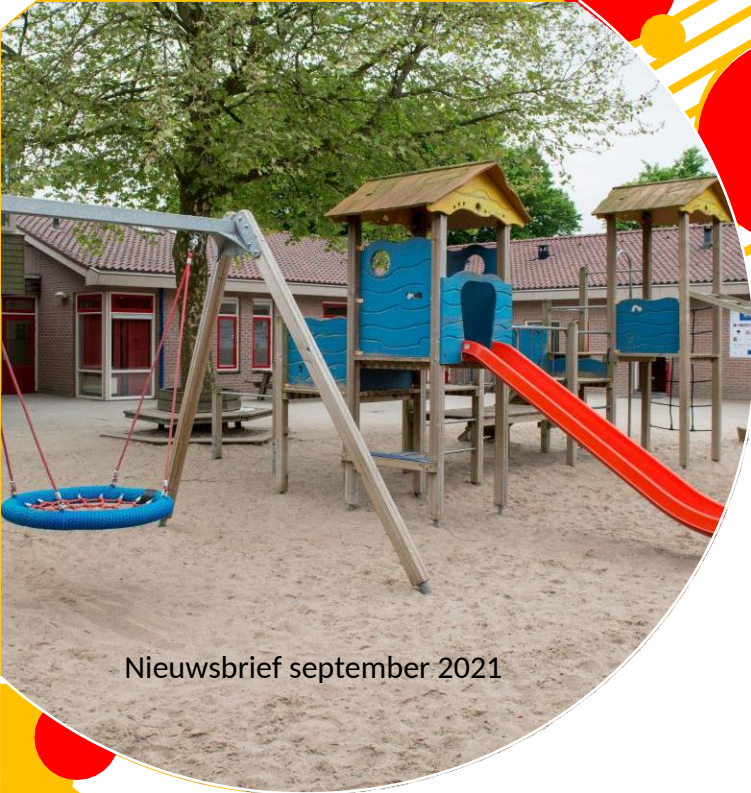
Nieuwsbrief september 2021